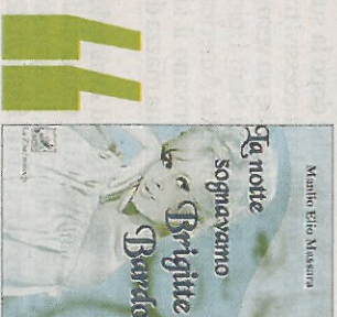
La notte sognavano B.B. Manlio Elio Massara EDIZIONI LA ZISA PP. 176 € 9,90

Edito da "Il Foglio" - collana Proma, "Agosto" presenta in copertina una foto di Albert Watson dal titolo "Take me away from here". Il romanzo, uscito a luglio di quest'anno, è diviso in diciotto capitoli.