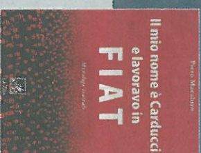
Il mio nome è Carducci e lavoravo in Fiat Piero Macaluso PP. 48 € 4,90

"Ma che vuoi dire diritto al lavoro?", si chiede Carducci ad un'assemblea in cui s'idenunciano le nuove forme di sfruttamento operaio legate alla progressiva macchinizzazione del processo produttivo. Già, che significato ha parlare di un "diritto" a proposito di un'attività che gli avvenire ormai di testa ogni volta che torna a casa. L'autore del libro "Il mio nome è Carducci e lavoravo in Fiat" è Piero Macaluso, attore, regista e autore di teatro. Vive e lavora a Termini Imerese).